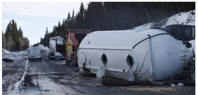
Olyckan i mars på E14 i Jämtland krävde ett dödsoffer.

Transportsektorn är även i år hårt drabbad av dödsolyckor. 14 chaufförer eller lokförare har omkommit vid färd eller i samband med lossning av gods. 35 procent av dödsolyckorna på jobbet i år har drabbat en chaufför. Hittills i år har 42 personer avlidit i arbetsplatsolyckor, fem av dem var utländska medborgare. Samtliga omkomna är män. Det har aldrig hänt sedan statistiken började föras 1955 att ingen kvinna omkommit på jobbet. I fjol dog fem kvinnor, 2022 var det nio, året innan tre och pandemiåret 2020 endast en.